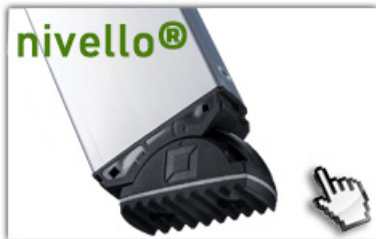
nivello® - Leiterschuhe 4-fach größere Auflagefläche