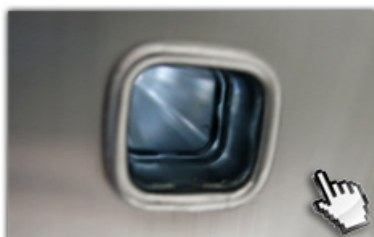
4-fach gebördelte Sprossen-Holmverbindungen