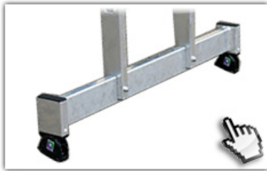
nivello® - Traverse extra hohe Standsicherheit