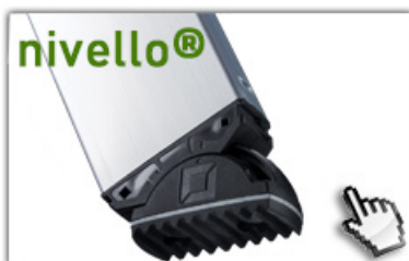
nivello® - Leiterschuh 4-fach größere Auflagefläche