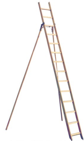
⚠ Abbildung abweichend! (Abb. Gartenleiter mit 14 Sprossen)