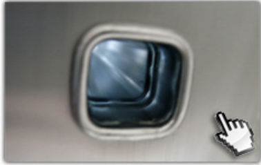
4-fach gebördelte Sprossen-Holmverbindungen