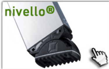
nivello® - Leiterschuhe 4-fach größere Auflagefläche