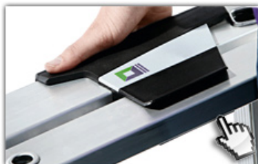
ergo-pad® Griffzone ergonomischer Tragekomfort

Günzburger Kunststoff-Stehleiter mit ergo-pad beidseitig begehbar