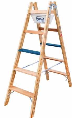
▲ Abbildung „Stufen-Stehleiter ERGO-Plus 2x5 Stufen“ (Art.-Nr. 2105-7)